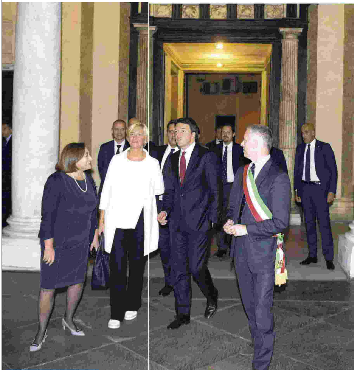
L'ARRIVO a Genova di Matteo Renzi, accolto in Prefettura dalle autorità