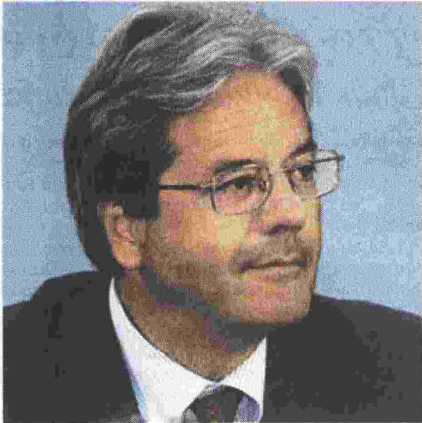
PRESIDENTE DEL CONSIGLIO Paolo Gentiloni